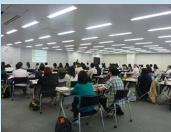
ユニットリーダー研修

介護過程の展開やリーダーシップ、介護報酬改定など、ニーズに合わせた研修を企画・開催しています。 平成25年度からはユニットケア研修事業を開始し、「人材確保が難しい状況においていかに質の高いサービスを提供するか」をテーマに独自カリキュラムを追加して実施しております。 平成29年度からは出前研修も開始し、手頃に研修を受講していただけるようになりました。