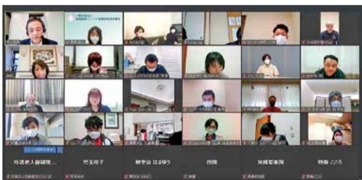
発表されたキャプションカードの評価、助言を受けて効果や課題を共有するオンライン参加者