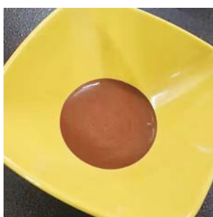
「牛乳」と「とろみ剤」を加えたチョコレート

「せんねん村」では直営のフードサービス部で調理・加工をすることで、最期まで口から食事を摂っていただけようサポートしている。骨折を機に病院から老健へ、その後、特養へ入所した全盲の80代女性、看取りの時期に好物のチョコレートを口から食べても加えるよう、「牛乳」と「とろみ剤」を加えて嚥下に配慮したチョコレートを作り、家族の前で提供した。本人は「おいしいよ」と喜び、家族からは感謝された。コロナ禍でも本人の意向に沿った支援を行うことができた。