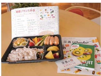
「ま・ご・は・や・さ・し・い」をテーマにメニューを考案した「健康バランス弁当」

コロナ禍の影響で、地域の高齢者を対象とした「ふれあいカフェ」や「介護予防教室」、「栄養相談会」などが開催できなくなった。そこで、職員に対し、「職員へ向け免疫力アップや健康増進を図る」ため、職員向けの「栄養便り」を作成したり、健康バランス弁当を販売したりした。取組後にアンケートを実施したところ、「朝食の大切さに気づいた」、「便秘が解消した」などの声が聞かれた。健康には自身の気づきが必要であり、見て食べて学ぶ食育の大切さや専門職に気軽に相談できる関係性の構築の重要性を再認識する機会となった。