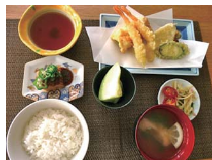
厨房職員が考案したメニュー

会社への月額管理費は年間約590万円減らすことができた。費用削減だけでなく、厨房職員のアイデアを取り入れるなど食の質もさらに良くなった。行事開催の頻度が増え、利用者や家族からも喜ばれている。