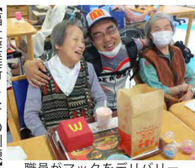
職員がマックをデリバリー