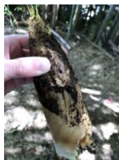
収穫したたけのこ

平成22年6月、神奈川県横浜市北東部の市街地に「ヴィラ都筑」が開設された。横浜市営地下鉄「センター南駅」、東急田園都市線「江田駅」から、バスで5分、緑豊かな地にある。敷地内の竹林では、たけのこが採れる。