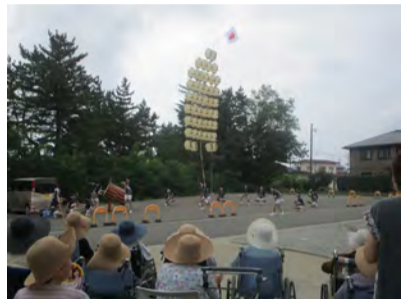
秋田県立大学の竿燈会が出竿

重要無形民俗文化財に指定され、東北三大まつりのひとつにも数えられている。竿燈全体を稲穂に、連なる堤灯を米俵に見立て、五穀豊穣や無病息災、技芸上達を願う行事だ。昨年の施設の夏祭りには秋田県立大学の竿燈会が出竿してくれた。いつもは物静かな入居者からも笑顔と一緒に「ドッコイショードッコイショ」の掛け声が聞かれた。○パパヘラ・アイス