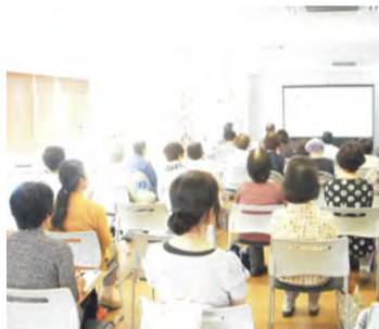
住民向け介護予防教室

2年前にグループ内の地域包括支援センターから特養「飯島」に異動してきました。職員と共に地域の人のつながりを大切に、地域に必要とされる施設にしていきたいと思っています。また、コロナ禍だからこそ、一つひとつの業務を見直し、創意工夫が生まれるチャンスと考えています。入居者様には変わらぬ日常を送っていただきたいと思っています。