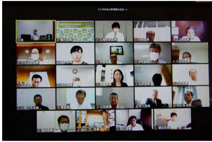
第183回介護給付費分科会

8月27日、第183回介護給付費分科会は2021(令和3)年度介護報酬改定に向けて介護老人福祉施設(特養)、老健施設、介護医療院、介護療養型医療施設について議論した。特養について厚労省は「個室ユニット型施設の推進に関する検討会」(メンバー・推進協、全国老健協など)の報告書を示し、1ユニット当たりの入居定員を15名程度以内まで増やすことや、個室的多床室の新設を禁止することなどを提案した。また委員から特養の現行報酬について「特養の3割余が赤字経営になつており、人件費や感染症対策などによるコスト増を反映していない」として基本報酬の引き上げを要望する意見が出た。