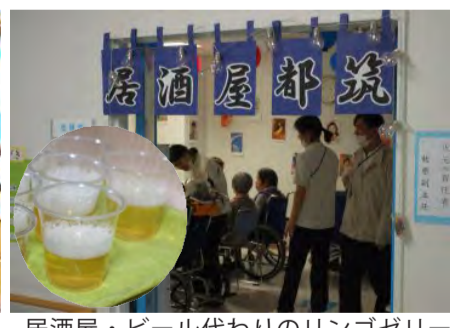
居酒屋・ビール代わりのリンゴゼリー