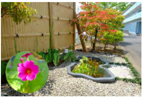
めだか池と池に咲いたクリンソウ

施設正面には日本庭園風のめだか池がある。今年には高山植物のクリンソウがピンク色の花を付け、施設を訪れる人や入居者を喜ばせている。