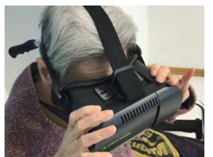
VRで花火大会を鑑賞

福祉分野でもVRの活用が始まっている。ヴィラ都筑では入居者のアクティビティの一環として、VRで花火大会の様子などを鑑賞してもら